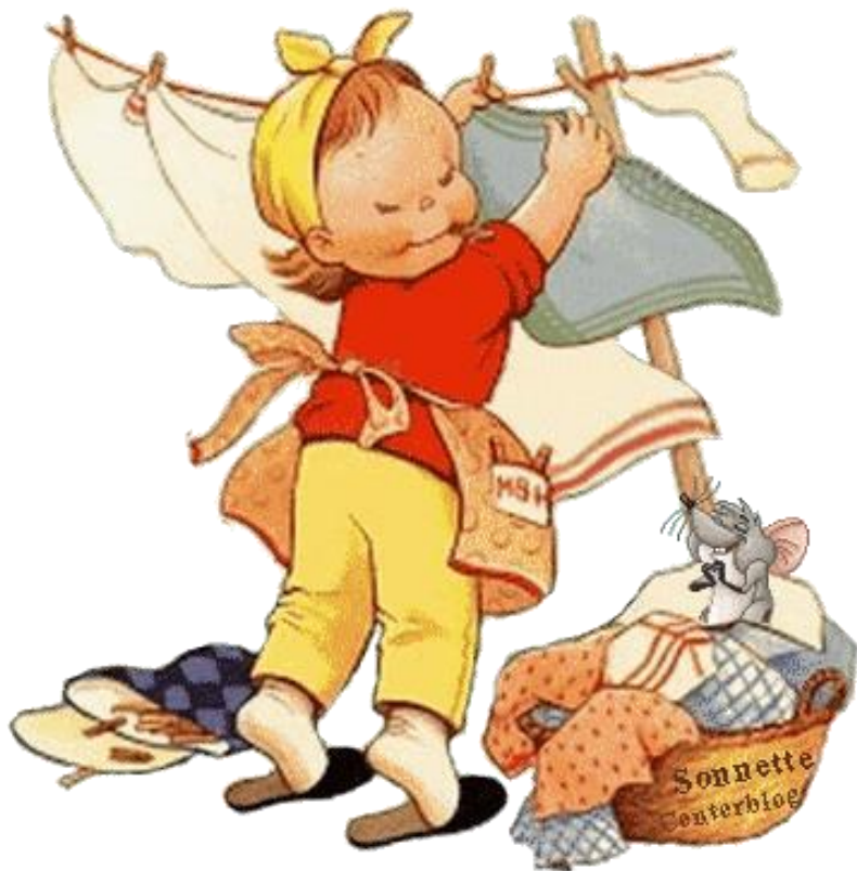
J'étends mon linge